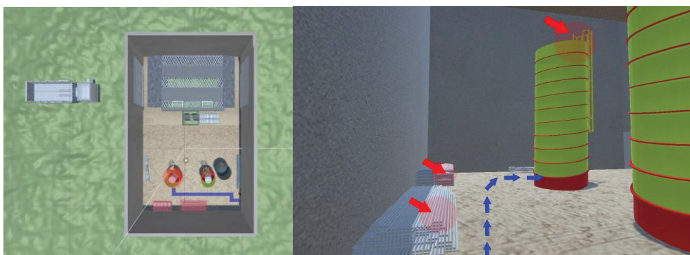
Figura 2. Imagem do ambiente em desenvolvimento e sinalização dos locais de risco.

Com isso, o atual protótipo desenvolvido apresenta ao usuário quatro diferentes cenários de testes, cada qual possui recursos visuais para auxiliar o jogador a identificar riscos presentes e os equipamentos adequados para a realização das atividades. Como demonstrado na Figura 2, o cenário apresenta ao usuário um percurso ideal a ser seguido e sinaliza através de setas vermelhas alguns dos riscos iminentes ao ambiente.