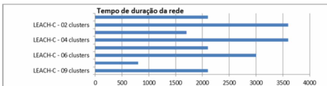
Gráfico 1 – Tempo de Duração da Rede em Segundos